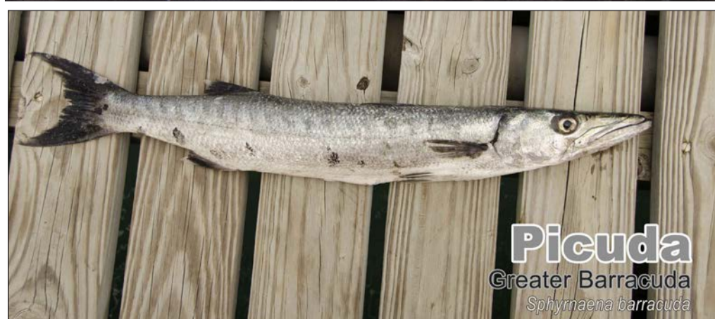
Picuda Greater Barracuda Sphyraena barracuda

B an papia di number di pisca. Bo conoce bo piscan- an? Un serie di articulo informativo cu ta ilustra al- gun pisca y nan number na Papiamento den cual Depar- tamento di Agricultura, Cria y Pesca, conoci como Santa Rosa kier comparti y alabes haya informacion for di pu- blico. Lesa na final di articulo con pa haci esaki.